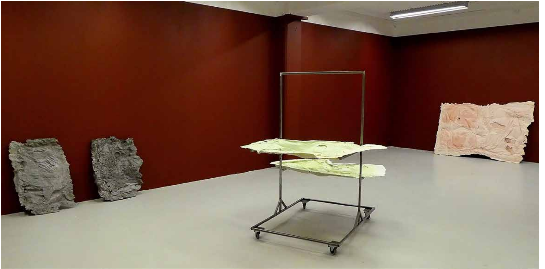
Sofie Eliassons «Fossil Beds», akrylbasert kunstharpiks.